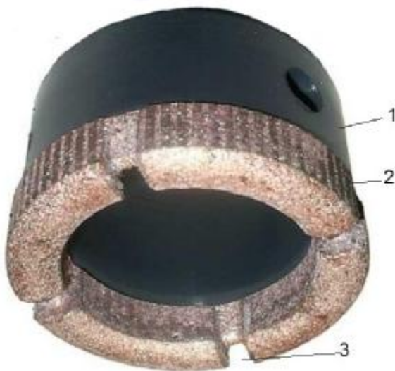
Рис. 1 – Загальний вигляд коронки: 1 – корпус; 2 – матриця; 3 – промивальні канали